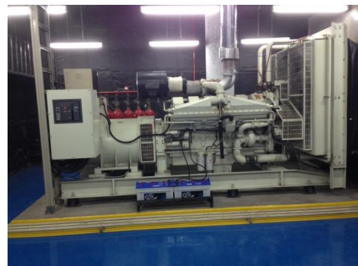
ภาพแสดง เครื่องกำเนิดไฟฟ้า Generator