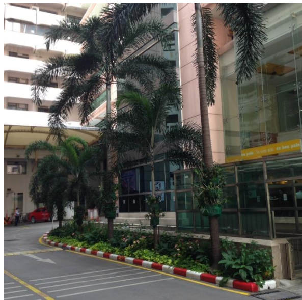
ภาพแสดง พื้นที่สีเขียวภายในโรงพยาบาล