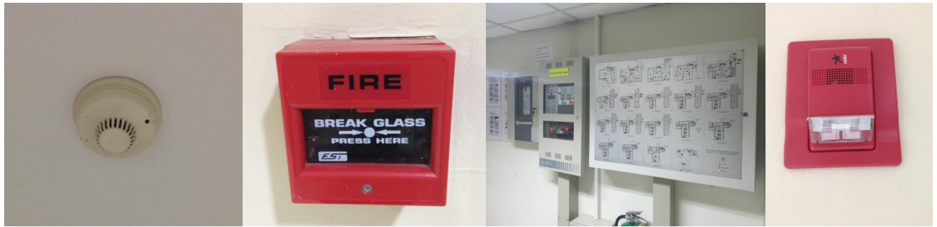
ภาพแสดง อุปกรณ์แจ้งเหตุเพลิงไหม้

โครงการ โรงพยาบาลกรุงเทพคริสเตียน (ส่วนขยาย) ระหว่าง เดือน มกราคม - มิถุนายน 2565