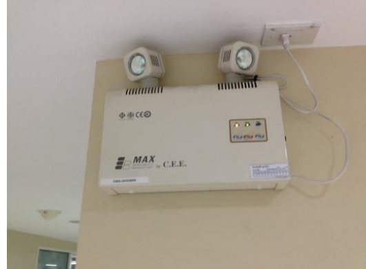
ภาพแสดง โคมไฟฉุกเฉิน