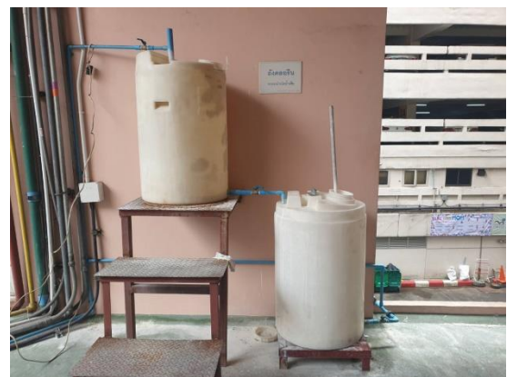
ภาพแสดง ระบบบำบัดน้ำเสียและถังเติมคลอรีน อาคารหมอแวลส์