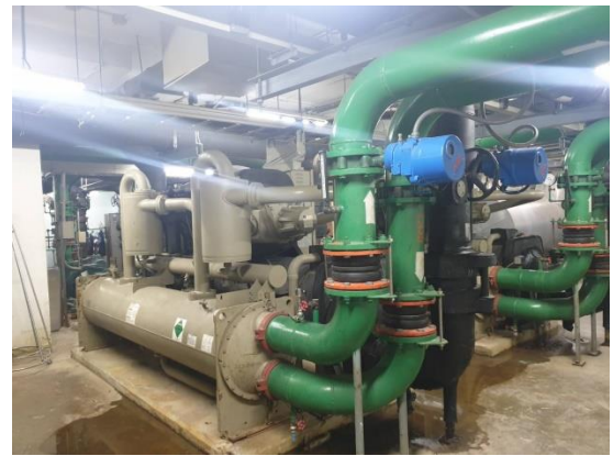
ภาพแสดง ระบบระบายความร้อนด้วยน้ำของเครื่องปรับอากาศ