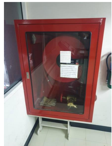
ภาพแสดง อุปกรณ์สำหรับดับเพลิง