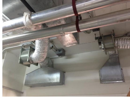
ภาพแสดง ระบบระบายอากาศ