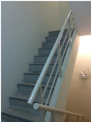
ภาพแสดง บันไดหนีไฟ