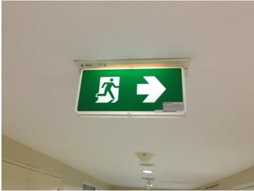
ภาพแสดง ป้ายทางหนีไฟ

โครงการ โรงพยาบาลกรุงเทพคริสเตียน (ส่วนขยาย) ระหว่าง เดือน มกราคม - มิถุนายน 2565