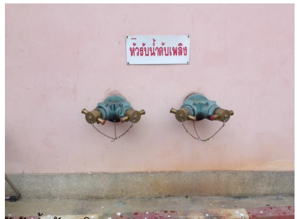
ภาพแสดง ปั๊มน้ำและหัวรับน้ำดับเพลิง